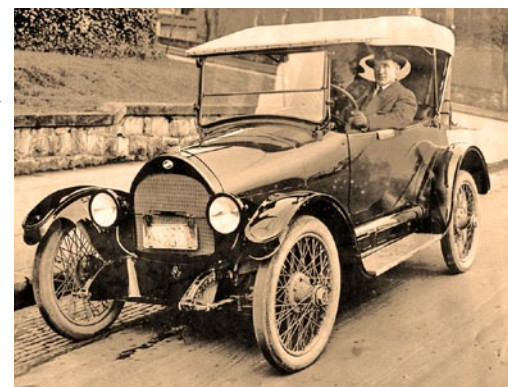
Nach Ch. Munger von R. Dobelli

Ruhig hörte er sich die jetzt etwas ausführlicher formulierte Frage an und antwortete dann: „Meine sehr geehrten Herren (damals gab es keine Damen unter den deutschen Physikern), ich hätte nie gedacht, dass mir in einer so fortschrittlichen Stadt wie München eine solch einfache Frage gestellt werden würde. Bitte sehen Sie es mir nach, ich werde meinen Chauffeur bitten, Ihnen diese zu beantworten.“